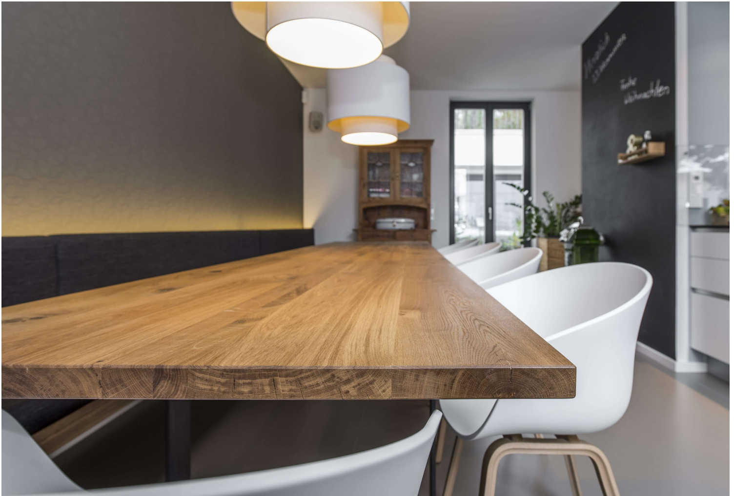
Weinmeisterhaus Potsdam; Design: BÜRO KÖTHER

optimal zur Geltung. Details wie der urige Geschirrschrank erinnern an das ursprüngliche Weinmeisterhaus und fügen sich perfekt ins Gesamtkonzept ein.